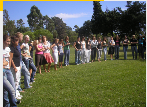
Grupo de estudiantes extranjeros 2006 - 2007 warming up para la Orientación Mid-Year.